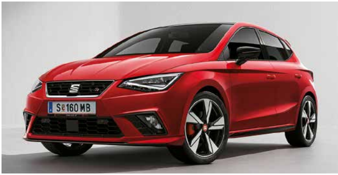
Frontspoileraufsatz In Kontrastfarbe lackierbar. 6F0071606 GRU