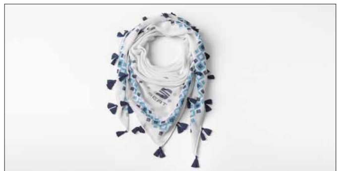
SEAT Schal Leichtes Tuch mit bedrucktem Muster und dezentem SEAT branding, Einfassung mit Quasten. Material: 100% Polyester. Größe: 120 x 120 cm. Farbe: weiß. 6H1084331 HAN € 17,80

Bitte beachten Sie, dass sich durch Sonderausstattungen und Zubehör relevante Fahrzeugparameter, wie z. B. Gewicht, Rollwiderstand und Aerodynamik verändern und sich dadurch abweichende Verbrauchswerte und CO 2 -Emissionen ergeben können. Die angeführten Preise verstehen sich – sofern nicht anders angegeben – zzgl. Montage sowie ggf. Einbaumaterial und sind unverb. empf. Richtpreise inkl. MwSt. Bitte beachten Sie, dass sich durch Sonderausstattungen und Zubehör relevante Fahrzeugparameter, wie z.B. Gewicht, Rollwiderstand und Aerodynamik verändern und sich dadurch abweichende Verbrauchswerte und CO 2 -Emissionen ergeben können. Angebote gültig solange der Vorrat reicht. Änderungen, Satz- und Druckfehler vorbehalten. Erhältlich bei jedem autorisierten SEAT-Betrieb. Stand 10/2018. Preise gültig bis auf Widerruf.