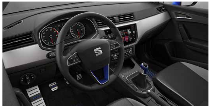
Innenausstattungs Dekor Individueller Blickfang im Cockpit des Wagens bestehend aus Schaltknopf und Lenkradblende. Auch in rot oder magenta. 6F0064230 W5L € 109,- 6F0072390 W5L € 54,90