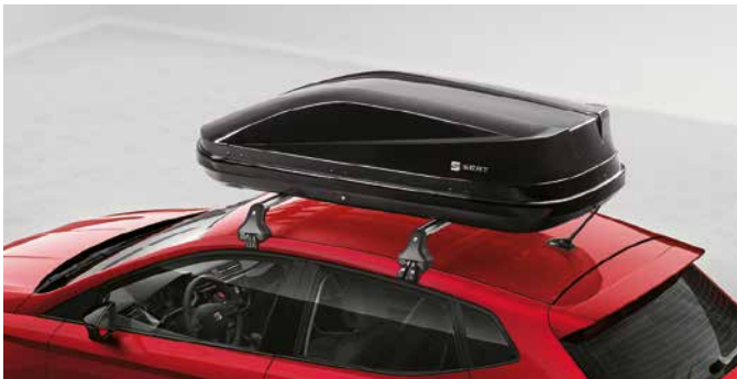
Dachbox Schwarz, 400 Liter. 000071200AB