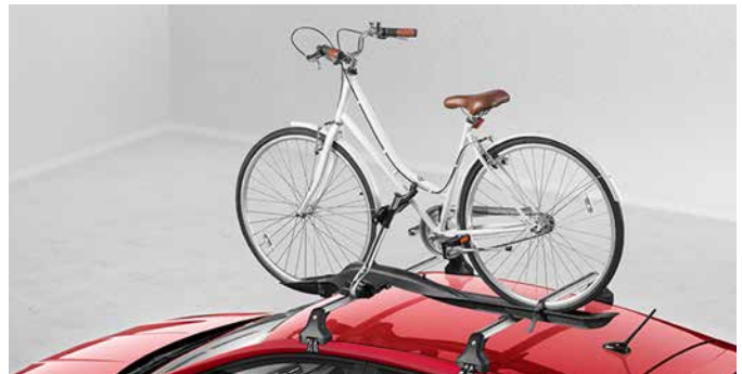
Fahrradhalter Für die Dachmontage. 6L0071128