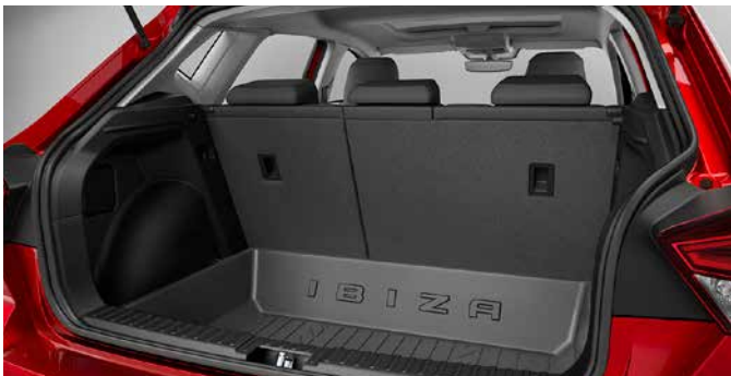
Laderaumschale hochrändig Schützt den Kofferraum vor Verschmutzungen. 6F0061201