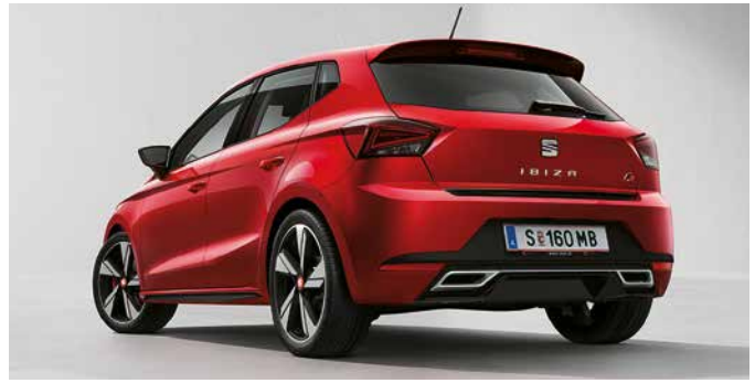
Dachkantenspoiler wertet die Heckpartie eindrucksvoll auf und verbessert die Aerodynamik 6F0071640 GRU