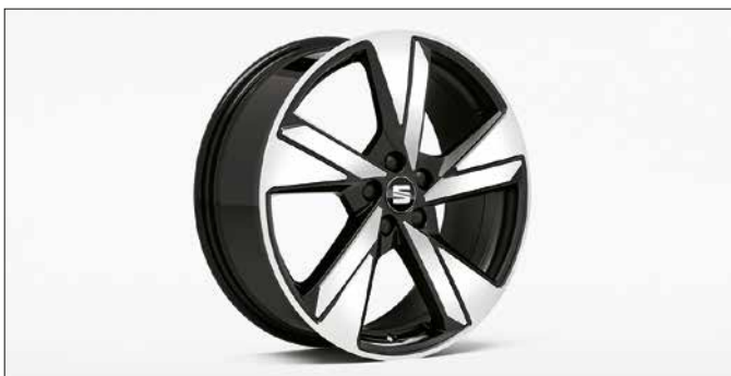
Leichtmetallfelge 18" Schwarz hochglänzend. 6F0071498